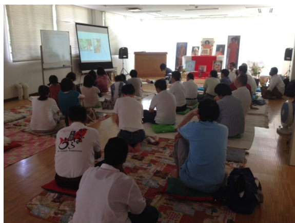
本年 5/31 日に名古屋で行われた第一回バガヴァッタムワークショップ in 名古屋の様子