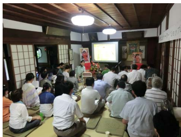
一昨年金沢（大乘寺）で行われたラーマヤナ ワークショップの様子

*ワークショップには音楽やクイズも含まれます。 プログラム詳細は変更の可能性もありますのでご了承下さい。